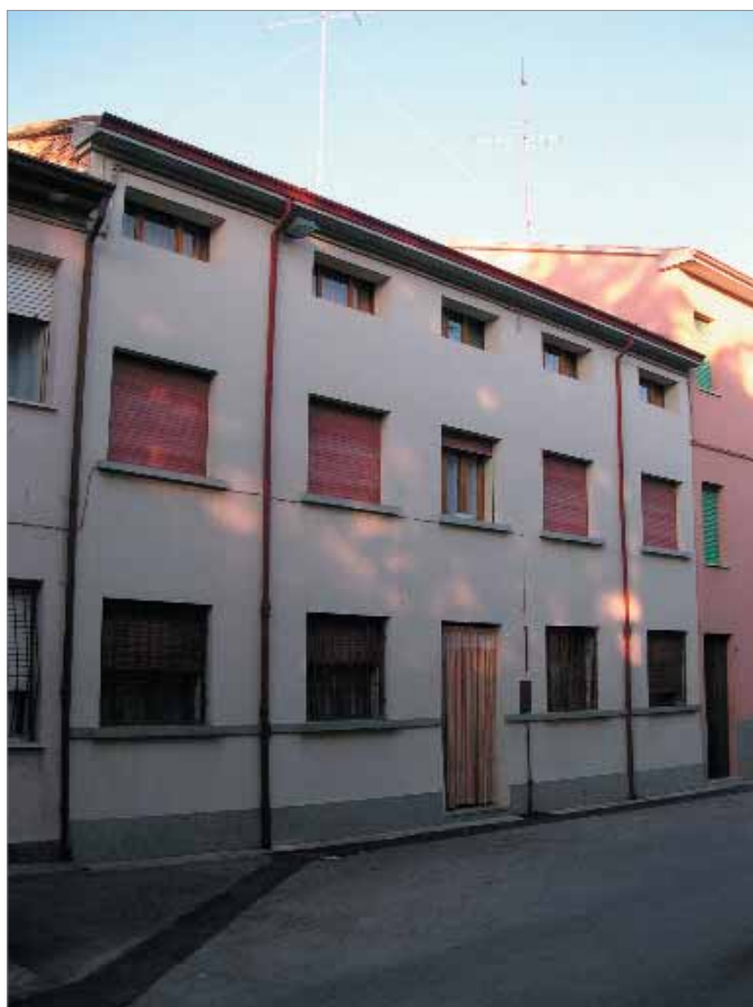
Via Berti 51 Fronte Principale